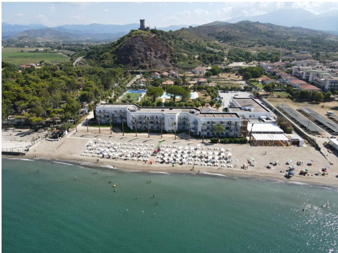
Hotel Eleamare. Sullo sfondo la Torre di Velia e il sito archeologico